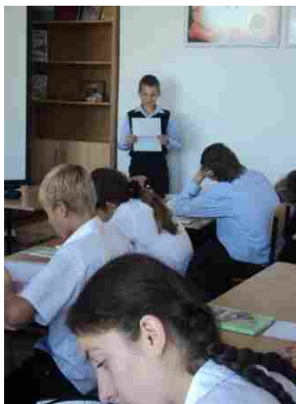
Фото1.Проведение опроса в 7классе МБОУ лицей №4

При этом в умелых руках исторические события могут ожить и передать молодёжи безграничную любовь к своей Родине, ради которой не жалко и жизнь положить.